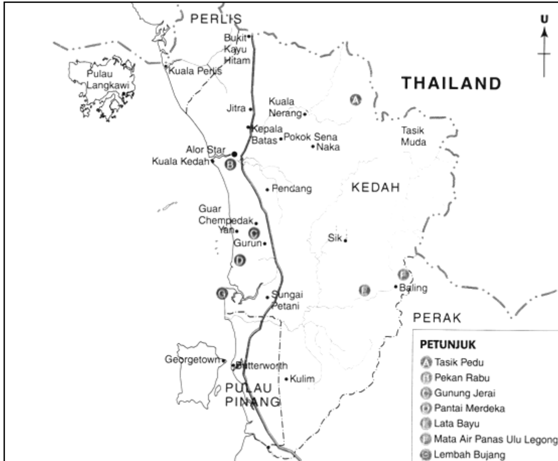
Peta 6.1: Pusat Pelancongan Negeri Kedah.

Jawab semua soalan di bawah berdasarkan Peta 6.1.