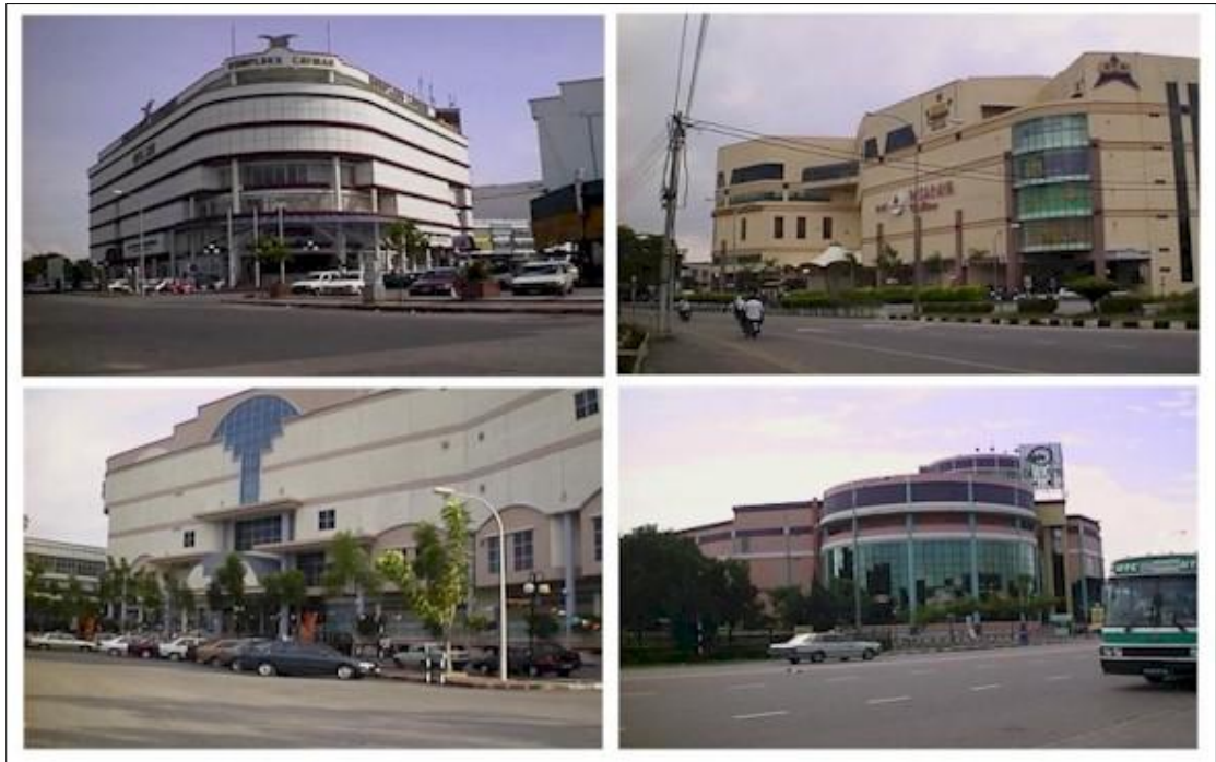
Gambar 1 : Bangunan – bangunan perniagaan utama dan bangunan pentadbiran Bandar Sungai Petani..

adalah luas berbanding dengan kawasan pusat bandar di mana kedudukan bangunan yang terlalu rapat.