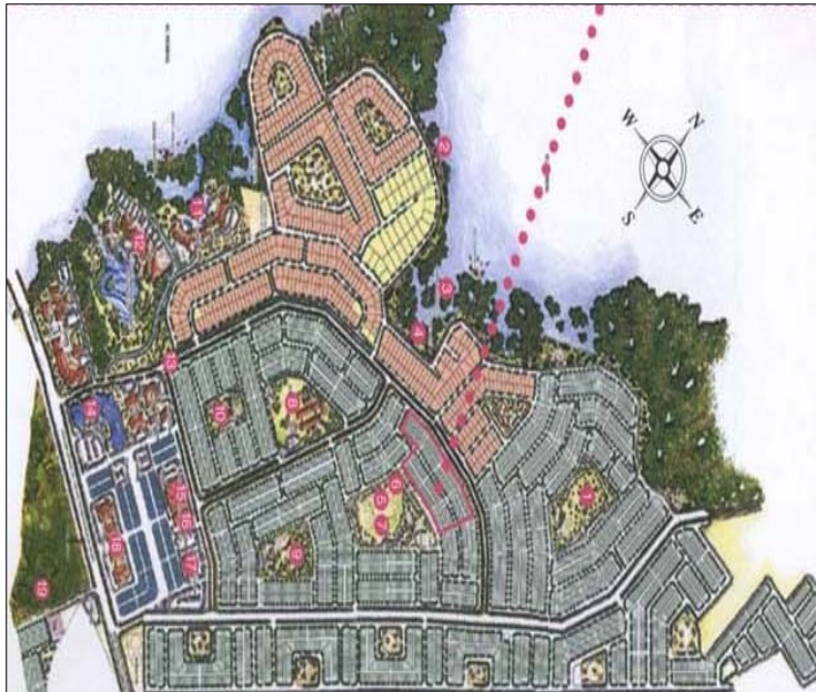
Rajah 1: Model Lanskap Bandar Laguna Merbok.

Sumber Pelan: Petani Jaya Sdn.Bhd, 2003.