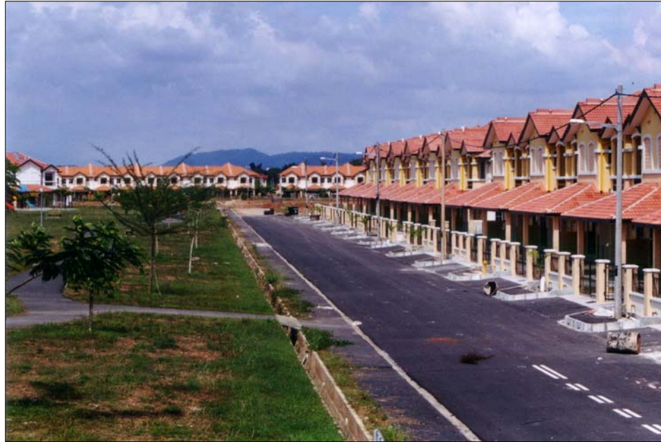
Gambar 3 : Lanskap penempatan kelas sederhana di Bandar Laguna Merbok.

Gambar : Augustine Towonsing, 14 November 2003.