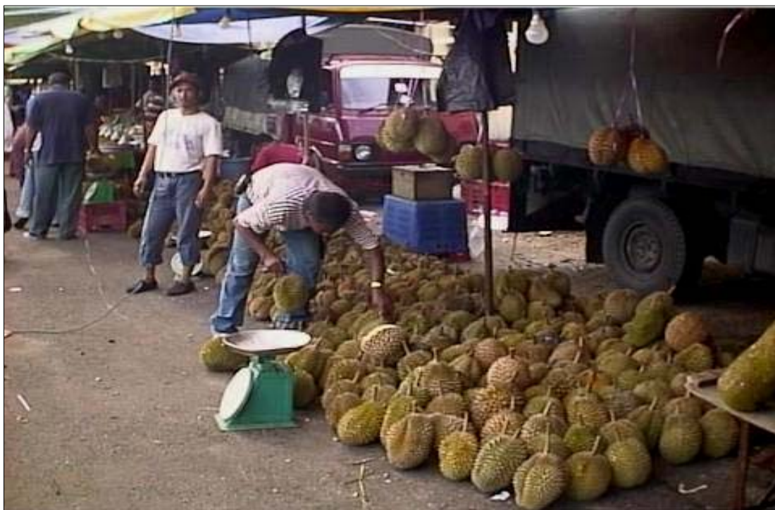
Gambar 4 : Lanskap budaya di pusat bandar menyediakan peluang ekonomi kepada penduduk yang terlibat dalam industri ekonomi peringkat primer.