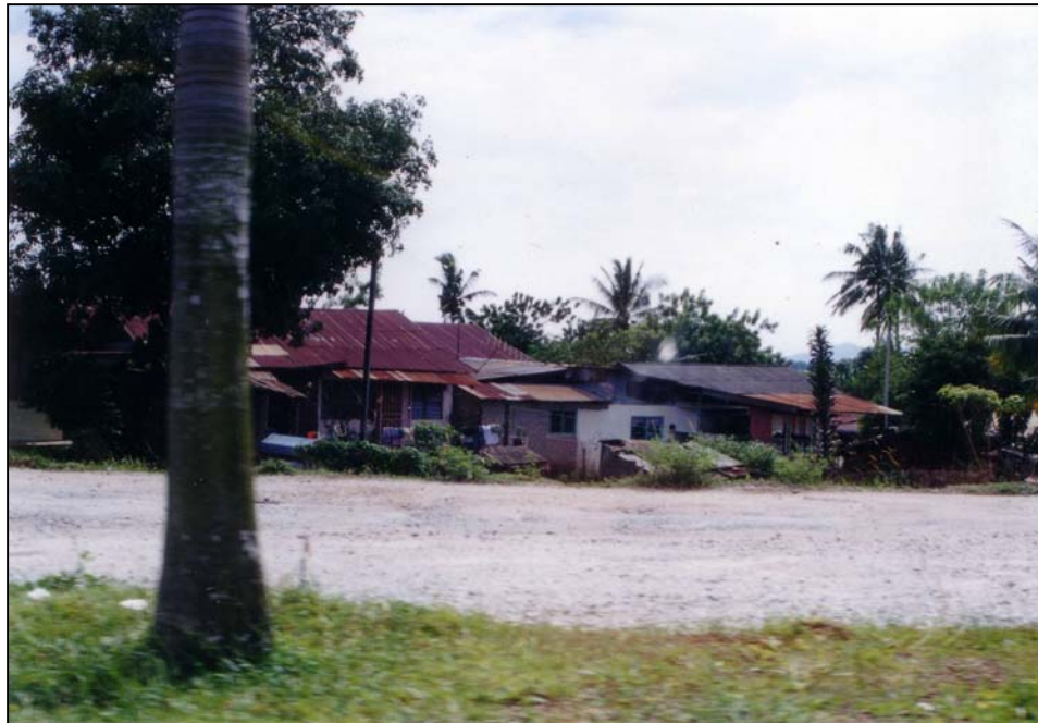
Gambar 2 : Lanskap budaya mencerminkan status ekonomi penduduk.

Kadang kala lanskap budaya itu juga mencerminkan status ekonomi, sosial dan aktiviti penduduk kawasan berkenaan.