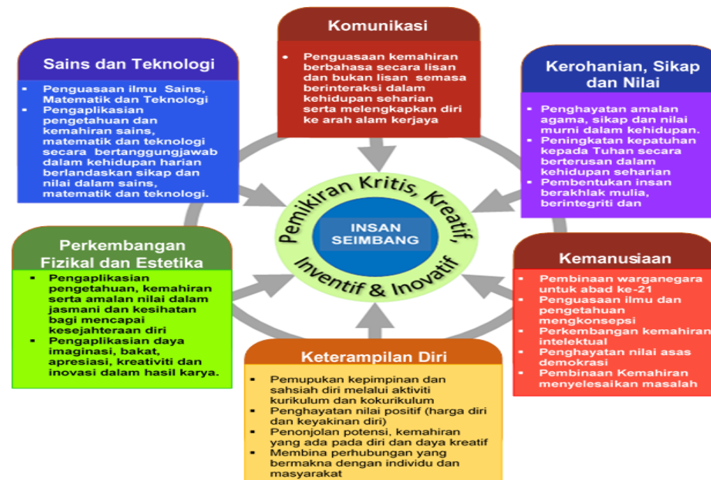
Rajah 1 Kerangka Kurikulum Standard Sekolah Menengah

Kurikulum Standard Sekolah Menengah (KSSM) dibina berasaskan enam tunjang, iaitu Komunikasi; Kerohanian, Sikap dan Nilai; Kemanusiaan; Keterampilan Diri; Perkembangan Fizikal dan Estetika; serta Sains dan Teknologi. Enam tunjang tersebut merupakan domain utama yang menyokong antara satu sama lain dan disepadukan dengan pemikiran kritis, kreatif dan inovatif. Kesepaduan ini bertujuan membangunkan modal insan yang menghayati nilai-nilai murni berteraskan keagamaan, berpengetahuan, berketerampilan, berpemikiran kritis dan kreatif serta inovatif sebagaimana yang digambarkan dalam Rajah 1.