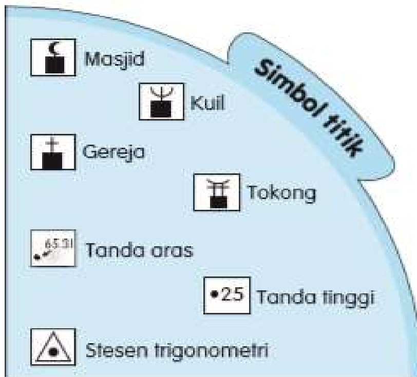
Rajah 3.2.3: Simbol Titik mewakili 1 unit ciri yang terdapat di atas permukaan bumi.