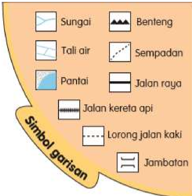
Rajah 3.2.4: Simbol garisan mewakili ciri di atas peta yang berbentuk garisan.